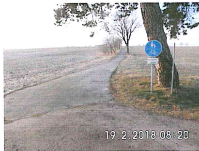
6 -02: Bestehender Weg von der S 196 in Richtung Freiberg