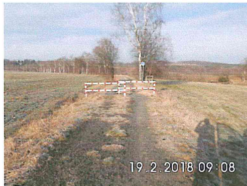
2 A-05: in Richtung Niederschöna