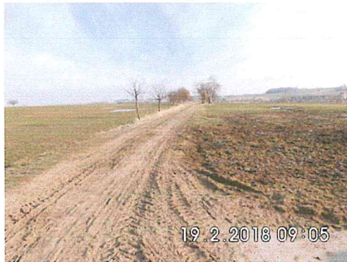
2 A-04: in Richtung Niederschöna