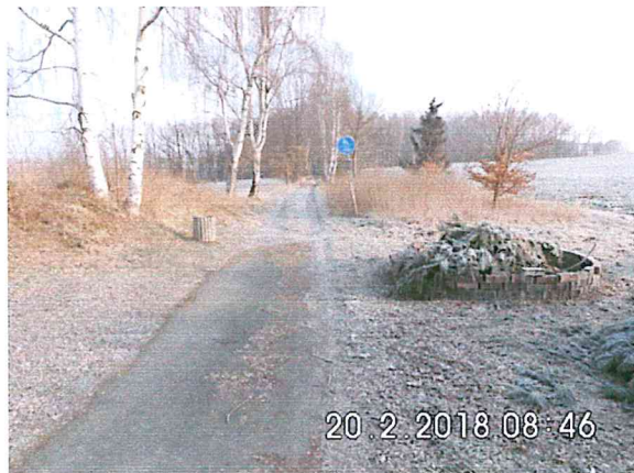
5 -02: in Richtung Dittmannsdorf