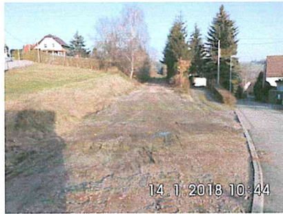
1 B-01: Bauanfang am Freiberger Weg Richtung Bahnhof Halsbrücke