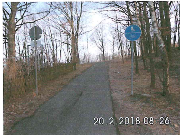
3 -01: Bauanfang am Buschrandweg in Richtung Hetzdorf