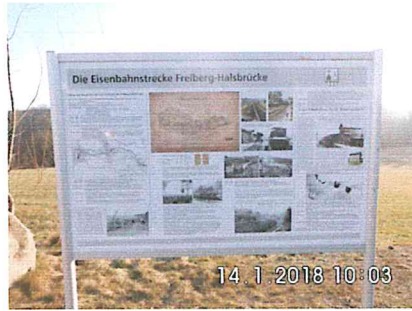
1 A-01: Schautafel am Bauanfang