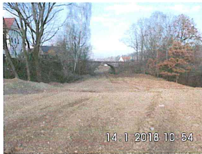
1 B-02: Verfüllung ehemaliger Bahneinschnitt