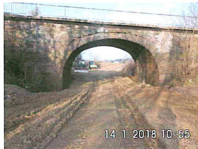
1 B-03: Unterführung der S 196