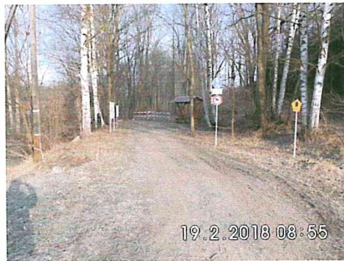
2 A-01: Bauanfang am Bahnhof Falkenberg in Richtung Niederschöna