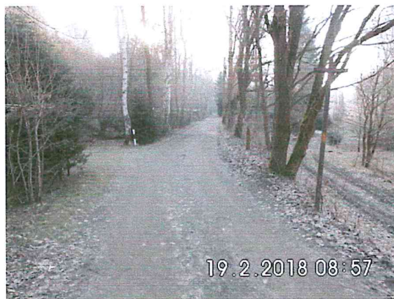
2 B-02: in Richtung Naundorf