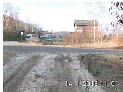
1 B-04: Bauende am Bahnhof Halsbrücke