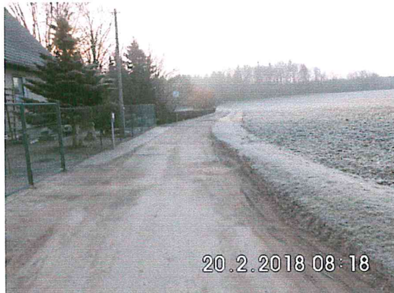
4 -01: Bauanfang am Wiesenweg in Richtung Naundorf