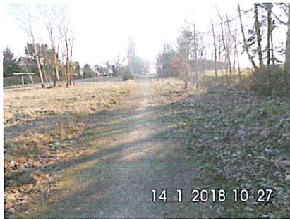
1 A-05: ehemaliger Bahnhof Tuttendorf