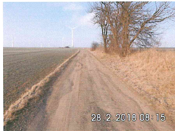
7 -02: Schnabelweg in Richtung „Alte Meißner Straße“