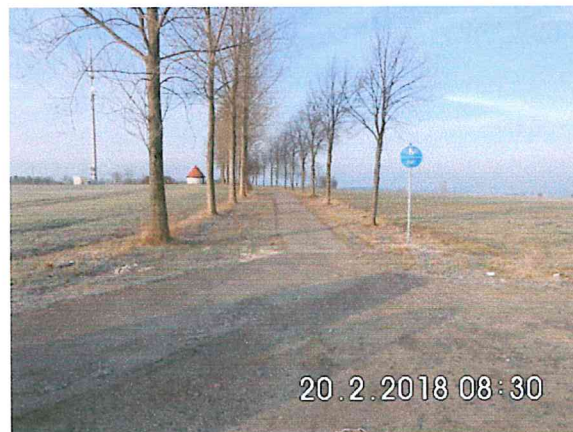
3 -02: Bauende an der Straße nach Hetzdorf in Richtung Naundorf