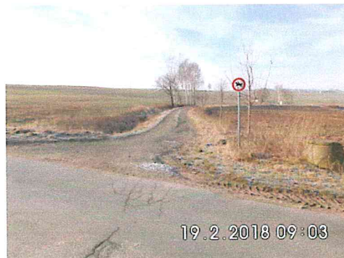
2 A-02: Verbindungsstraße nach Oberschaar in Richtung Bahnhof Falkenberg