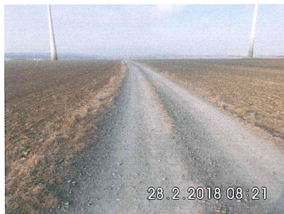
7 -03: Bauende an der Gemarkungsgrenze