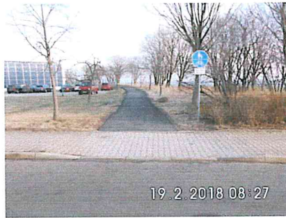
6 -01: Bestehender Weg vom Gewerbegebiet „Schwarze Kiefer“ in Richtung Halsbrücke