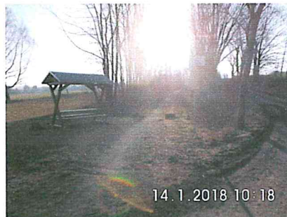
1 A-03: vorhandener Rastplatz