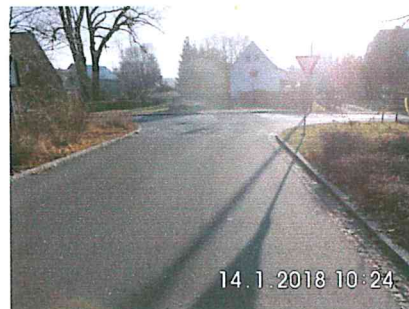
1 A-04: Kreuzung mit Dorfstraße Tuttendorf