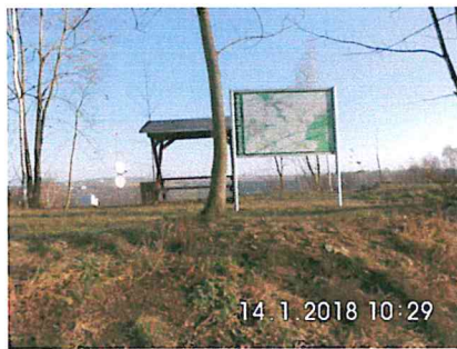
1 A-06: Rastplatz nach Bahnhof Tuttendorf