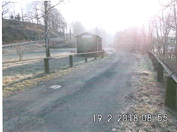
2 B-01: Bauanfang am Bahnhof Falkenberg in Richtung Naundorf