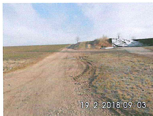
2 A-03: in Richtung Niederschöna