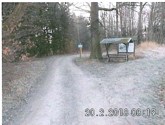
4 -02: Bauende an der Gemarkungsgrenze in Richtung Naundorf