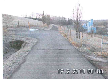
6 -03: Bestehender Weg entlang der S 196