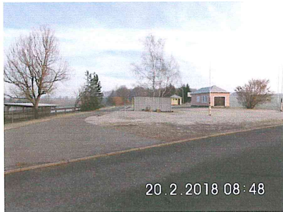
5 -01: Bauanfang am Bahnhof Oberschaar in Richtung Dittmannsdorf