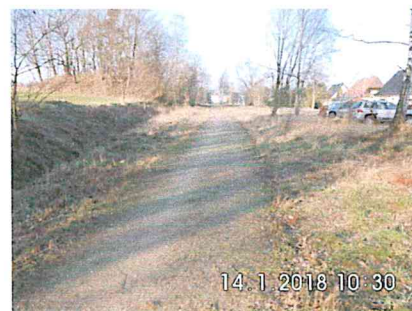
1 A-08: Ausbaugrenze an der Gemarkung Freiberg