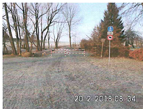
2 A-06: in Richtung Bahnhof Falkenberg