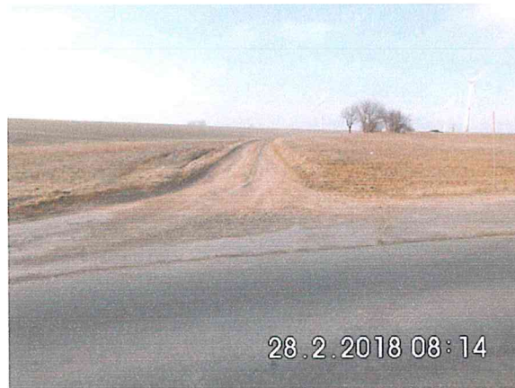
7 -01: Bauanfang an der Biebersteiner Straße