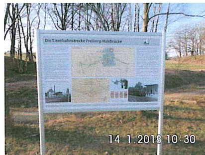
1 A-07: vorhandene Schautafel