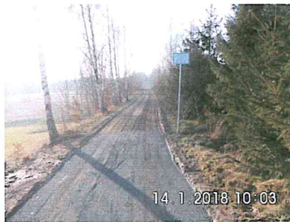
1 A-02: Bauanfang in Richtung Freiberg