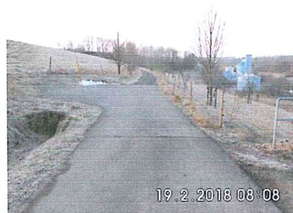
6 -04: Bauanfang an der Befestigungsgrenze Lossnitzer Weg bis zur Gemarkungsgrenze Freiberg